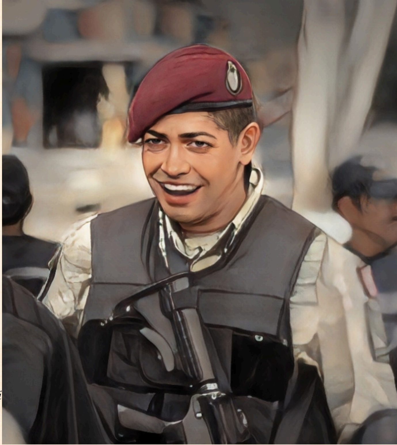
illüstrasyon: Ramazan KARTAL